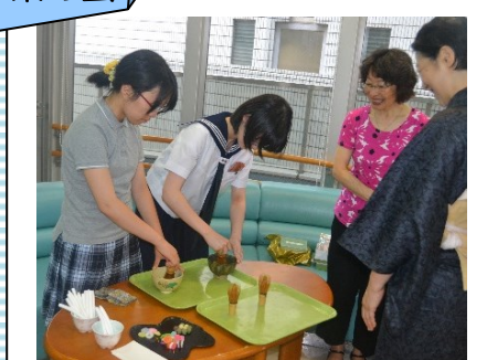
特別養護老人ホームで、高齢者の方に抹茶を振る舞いました。