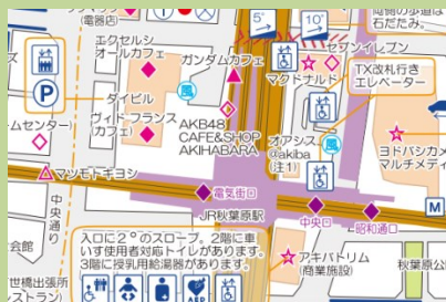
バリアフリーマップ

今日参加した調査は既存のマップを再調査したもので、10月上旬に発行する予定です。