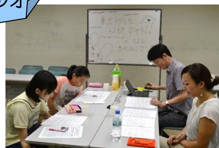
首都圏のNPOやボランティア等を紹介するインターネットラジオ番組の収録体験をしました。