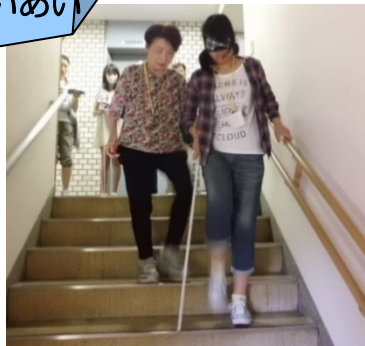
アイマスク体験を通して、視覚障がい者の理解を深めました。